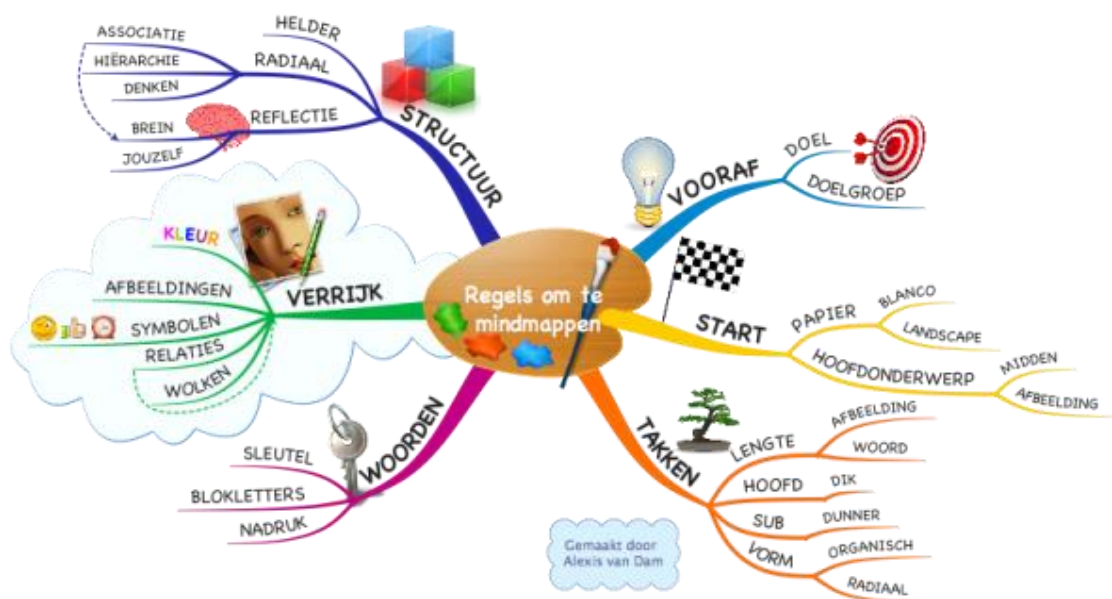
FIGUUR 1: EEN MINDMAP OVER HOE JE EEN MINDMAP MAAKT OP ALEXVANDAM.NL